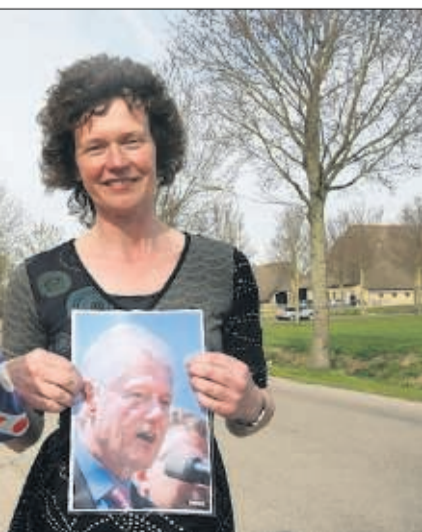
komt 'heel erg leuk'.