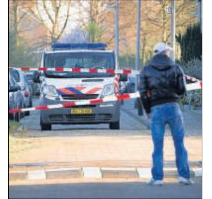
De politie zette de wijk Broekhorst in Alphen aan den Rijn af voor onderzoek.